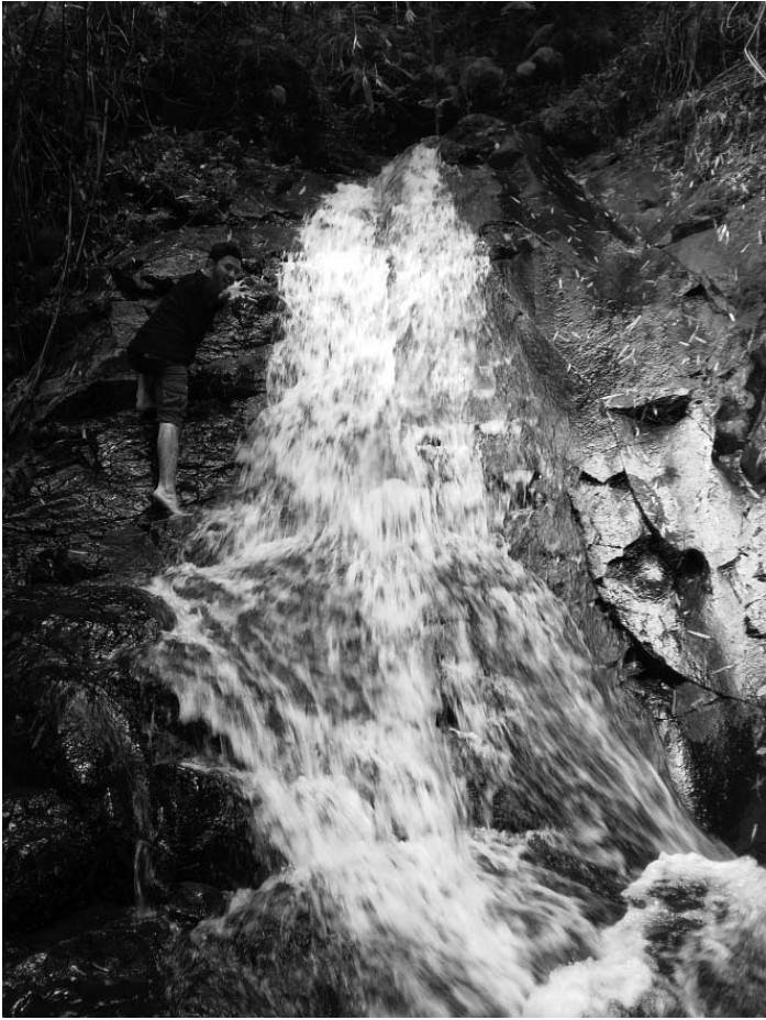
(Gambar: Air Terjun Lantai 1)