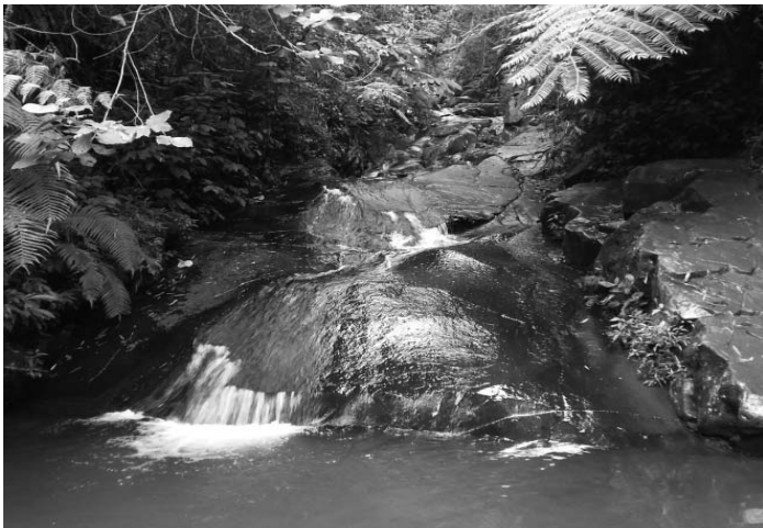
(Gambar: Waterboom Alam)

Keunikan lainnya dari air terjun ini adalah kejernihan air yang jatuh dari atas tebing dan sangat dingin. Hal itu yang menjadikan magnet bagi para pengunjung untuk datang ke tempat yang tersembunyi ini.