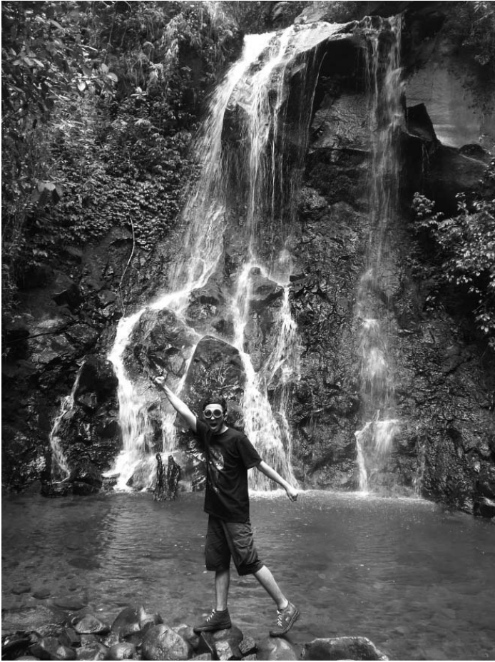
(Gambar: Air Terjun Lantai 3)